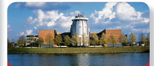
Fig. 6: Une fusée ? Non, un musée !