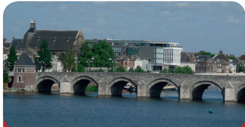
Fig. 1: Le plus vieux pont de la Meuse (le «Servaasbrug»)

Maastricht est la capitale de la province néerlandaise du Limbourg et compte environ 120 000 habitants. Maastricht est donc la troisième plus grande ville de l'Euregio. Maastricht est aussi une des villes les plus riches et les plus anciennes des Pays-Bas.