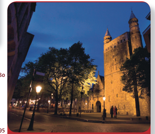
Fig. 3: Impressionnante : la Basilique Notre-Dame