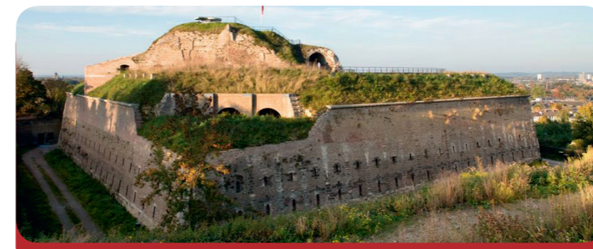
Fig. 5: Des murs massifs : le Fort Sint Pieter

Beaucoup de jeunes s'installent à Maastricht pour apprendre leur futur métier dans une haute école. Treize mille étudiants et étudiantes vont à l'Université de Maastricht (fig.7) pour devenir médecin, avocat ou entrepreneur. Comme ces étudiants viennent de nombreux pays différents, les cours sont souvent donnés en anglais. L'Université et l'Académie des Beaux-Arts de Maastricht attirent également de nombreux étudiants des pays voisins : d'Allemagne et de Belgique.