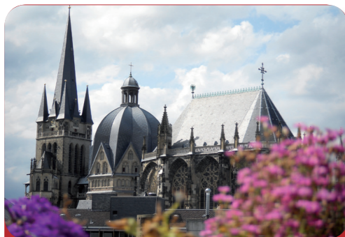
Afb. 1 - Het oudste deel is ruim 1 200 jaar oud: de Dom van Aken.

Iedere stad heeft ook dingen die andere steden niet hebben. Met de stad 10 Aken (250 000 inwoners) is dat net zo: van alle grote steden in Duitsland is het de stad die het meest westelijk ligt en direct aan de grens met Nederland en België. Men spreekt daarom wel van het 15 “Drielandpunt”.