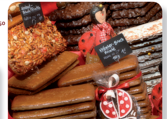
Afb. 6 - Het lekkerste souvenir uit Aken: de “Aachener Printen”.