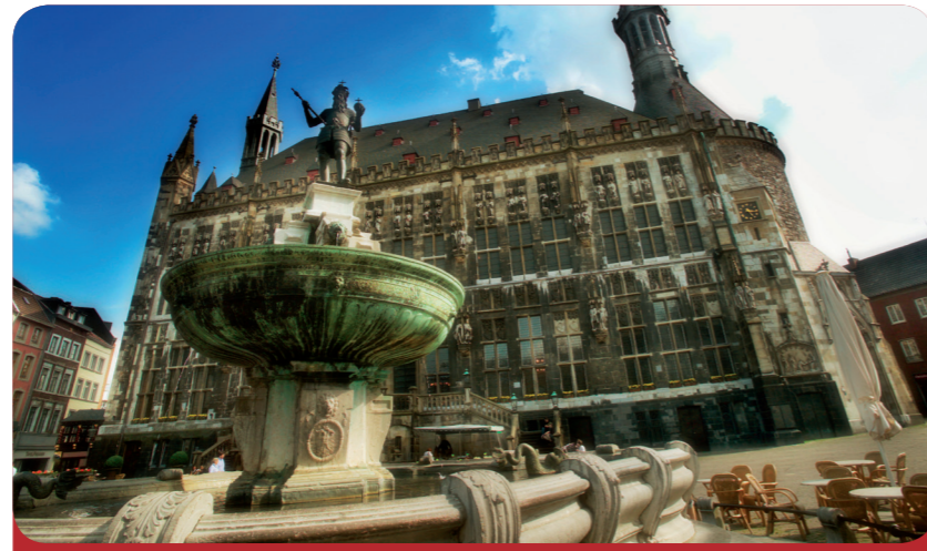
Afb. 2 - Hier in het stadhuis werkt de burgemeester. Hij reikt ieder jaar de Karelsprijs uit. Op de fontein is Karel de Grote afgebeeld.

In Aken ligt de grootste universiteit van de Euregio, de RWTH. 40 Universiteiten zijn scholen waar jonge mensen een beroep kunnen leren: arts, 20 architect, auto-ontwerper en nog veel andere beroepen. Er zijn ook beroepen waarvoor je niet naar de universiteit 45 gaat, maar die je beter in een werkplaats of bedrijf leert: bijvoorbeeld het beroep 25 van meubelmaker of monteur.