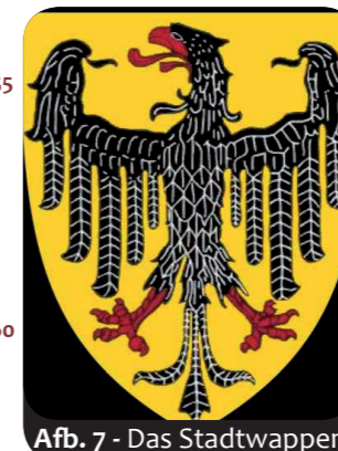
Afb. 7 - Das Stadtwappen

Er is nog een andere gebeurtenis die in Aken éénmaal per jaar plaatsvindt: het CHIO , het grootste en meest geliefde ruitertoernooi ter wereld (de afkorting is 60 Frans: “ Concours Hippique International Officiel ”). Het groene grasveld in het stadion, waar de hindernissen op worden geplaatst, is 120 bij 150 meter groot, meer dan twee keer zo groot als een voetbalveld. 40 000 65 toeschouwers kunnen hier naar het concours kijken (afb. 5). Bij een ruitertoernooi horen bovendien ook dressuur en races met paard en wagen. Iedere zomer komen ruiters en toeschouwers uit vele landen naar Aken om aan het toernooi deel te nemen.