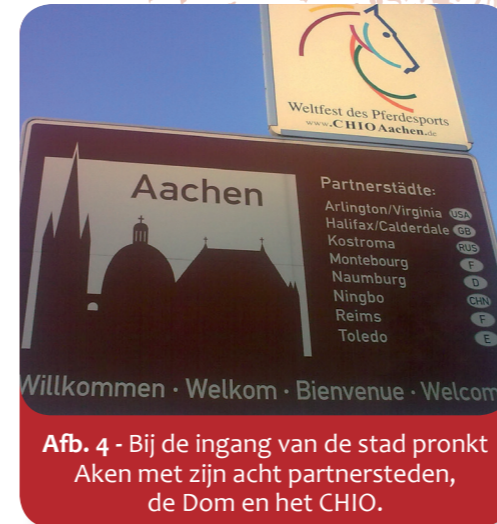
Afb. 4 - Bij de ingang van de stad prinkt Aken met zijn acht partnersteden, de Dom en het CHIO.

De Karelsprijs. Karel de Grote heet in het Latijns Carolus Magnus, vandaar ook zijn Franse naam: “Charlemagne”.