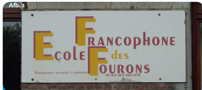
Bijzondere situatie in Voeren: hoewel de plaats bij het Nederlandse taalgebied hoort, is er hier ook een Franstalige basisschool.

In de Euregio bestaan er veel verschillende schoolsystemen. Soms zijn de verschillen erg groot. Dat begint al met de leerplicht : in Nederland moeten kinderen vanaf 5 jaar naar de basisschool, in België en Duitsland pas vanaf 6 jaar. Is dat wel eerlijk of leren de Duitse en Belgische kinderen dan niet minder?