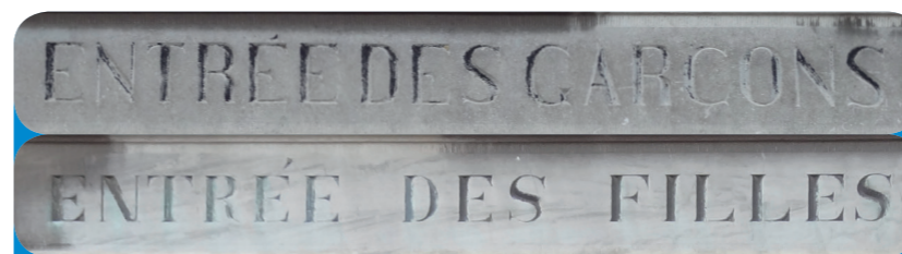
Afb. 3 - Deze school in Hombourg (Wallonië) had vroeger twee ingangen: één voor meisjes en één voor jongens.

MITTEL UND WEGE MOYENS ET MANIERES MIDDELEN EN WEGEN